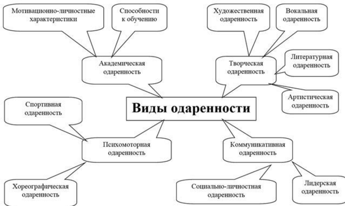
Схема 1. «Виды одаренности»